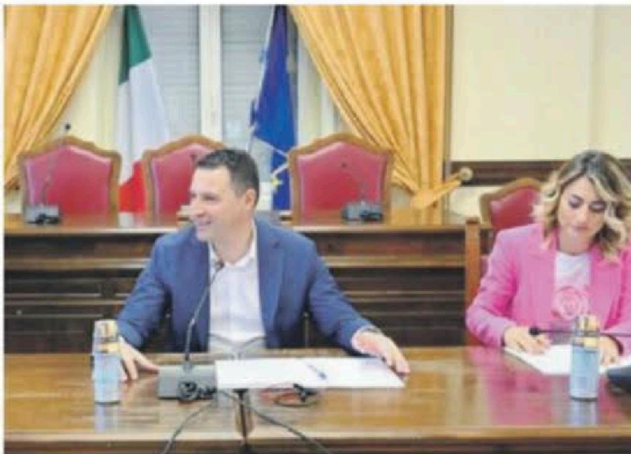
Un momento della presentazione del Festival dei Giovani